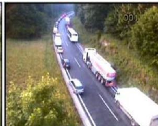
A2/E70 Ljubljana - Pluska, odsek Peč - Višnja Gora, pogled proti Novemu mestu