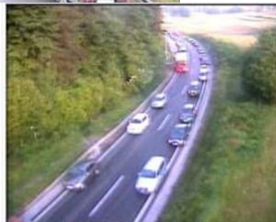
A2/E70 Ljubljana - Obrežje, odsek Peč - Višnja Gora, pogled proti Ljubljani